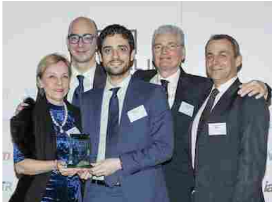
Bugnion ai Global Awards